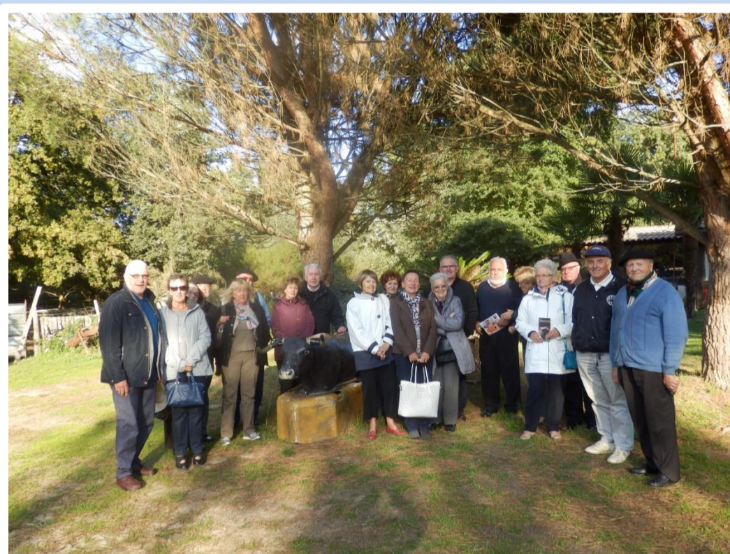
Le groupe à la Ganaderia de Buros