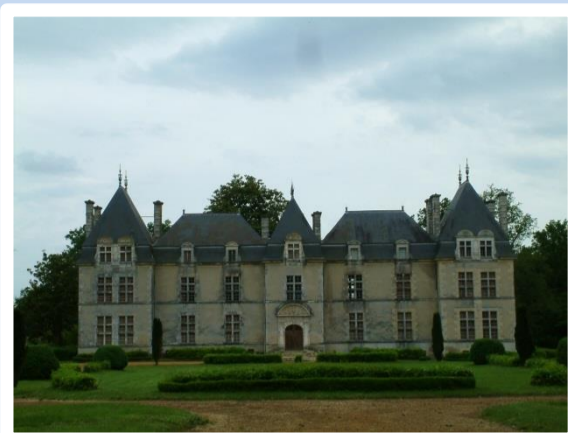
Le château de Ravignan et la visite de son chai (Bas-Armagnac)

3 Octobre 2015 – Dans les Landes... (Château de Ravignan, Saint-Justin, Buros)